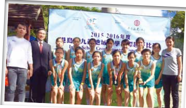
女子丙組勇奪冠軍寶座，乙組獲得亞軍，我們成為了女子團體第二！

我很榮幸可以成為越野隊隊長，每次訓練帶領着大家，見證着越野隊由零開始，到現在已經成為一隊完整的校隊。如果再給我一次選擇我不參加越野隊，我會好肯定回答：我會參加。我沒有後悔參加越野隊，雖然會用了很多時間去訓練，但越野帶給我的是一個美好的體驗，是一個挑戰自己極限的成長路。學會的更是做人的道理——凡事只要相信、堅持，就能突破自己的限制，跳出自己的世界！