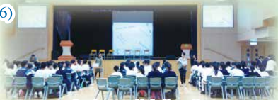
Opening assembly for Happy Hours