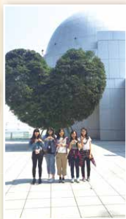
參觀澳門各名勝古蹟