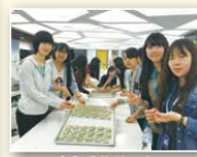
參觀維格夢工廠 - 親手製作愛心鳳梨酥