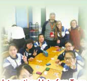
International Interface Team lunch visit with 2B