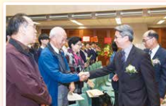
梁校長逐一向來賓道謝