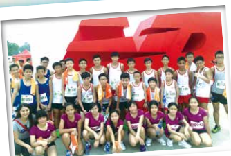
除了學界比賽，我們也有參加其他機構舉辦的長跑比賽，吸收經驗之餘亦擴闊了眼界