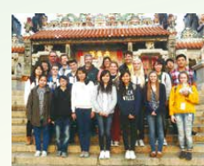
Outside Pak Tai Temple

I have not been to Cheung Chau before. I felt so excited that I could go sightseeing with my friends and the South Dakota Missionary Team. After the trip, I have learned many things about Cheung Chau such as Pak Tai Temple, Cheung Po Tsai Cave, Tin Hau Temple and the Cheung Chau's specialty food and snacks. Moreover, I tried some giant fish balls, mango mochi and waffle in Cheung Chau. They are very delicious. I was over the moon.