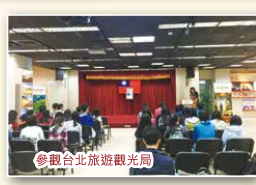
參觀台北旅遊觀光局