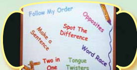
A variety of games at Happy Hours