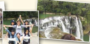
遊覽十分瀑布及放天燈