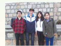
Here comes a new student in CLS!

I went to Cheung Chau with the missionary team from South Dakota Divine Shepherd Church and some of my schoolmates on 30th January, 2016. In the beginning, my friends and I were shy and we did not know how to start a topic with the Americans even though we wanted to. While the others were chatting with the missionary team happily, we just stood behind them. Later, we became more proactive and started talking with the Americans. There's no doubt that all of them are so nice and gentle. Unfortunately, this was the last year we could join the sightseeing trip. Hope I can still meet them next time.