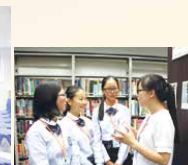
本校同學耐心為衢州一中同學講解