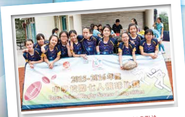
一年過後，新血加入，新舊隊員相處融洽，而且很合拍，將會愈戰愈強！