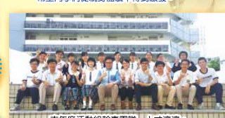
本年度活動組幹事團隊「人才濟濟」