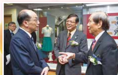
主禮嘉賓於典禮前參觀本校校史館