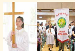
同學引領主禮嘉賓進場……