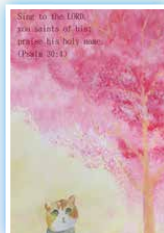
6F 溫慧儀 《向耶和華唱頌歌》