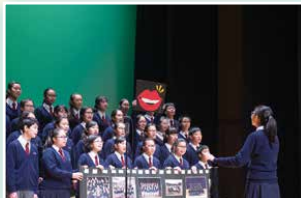
中三級最佳作曲、最佳普通話演繹及最佳指揮：3D