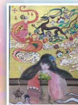
6F 李欣儀 《蝶夢敦煌》(混合媒介)