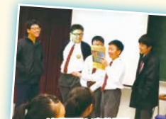
以利亞團S1宗教體驗