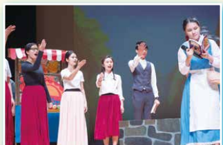
社際合唱比賽冠軍：馬太社