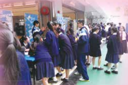
Students lining up at booth games