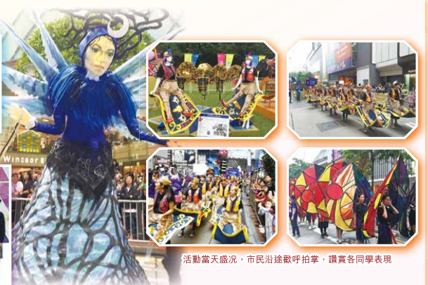
活動當天盛況，市民沿途歡呼拍掌，讚賞各同學表現