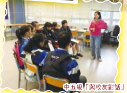
中五級「與校友對話」