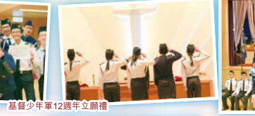
基督少年軍12週年立願禮