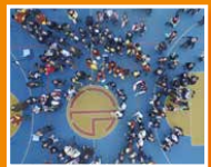
嘗試用航拍拍攝的畢業茶會片段