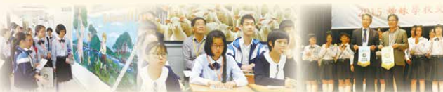
姊妹學校合作交流，締結友誼。