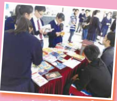
Students looking over the selection of book prizes