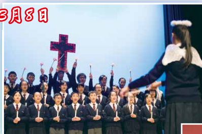
中一級班際合唱冠軍及最佳指揮：1D