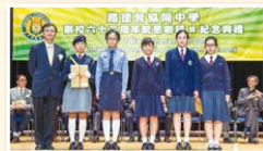
同學們於活動及服務皆有出色的表現