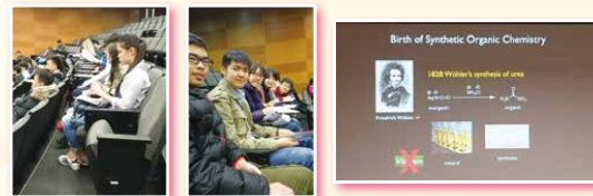
中四同學到中文大學參加科學講座