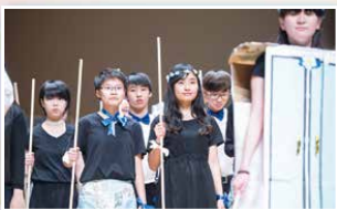
社際合唱比賽亞軍：馬可社