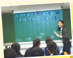
中四級「生涯規劃課程」