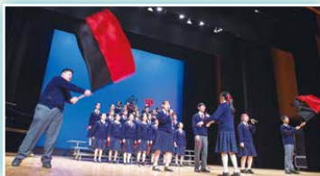
家長教師盃我最喜愛班級、中二級最佳演繹、班際合唱冠軍及最佳指揮：2D