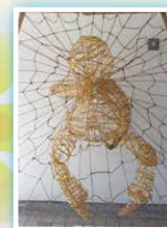
6B 潘美賢 《弱肉強食》