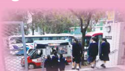
Students getting a well-deserved reward