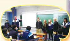
International Interface Team lunch visit with 5C