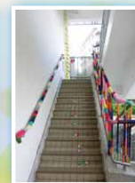
6A 林嘉慧 《四季之暖護》