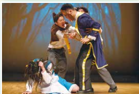
社際合唱比賽：約翰社精彩片段