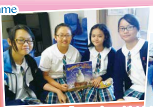
Eager readers and their helper at the lunchtime reading program