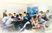
Miss Teffaine (NET) leading the After-school Phonics Program