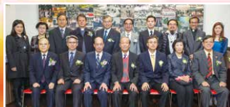
典禮嘉賓們百忙抽空前來賀、濟濟一堂拍照留念