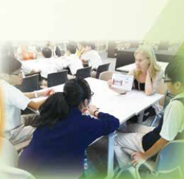
Miss Jeffaine (NET) guides a small group in a reading lesson.