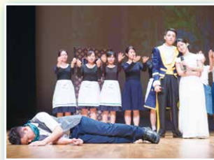
社際合唱比賽：路加社精彩片段