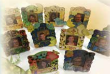
中四同學製作格畫相架送美國短宣隊