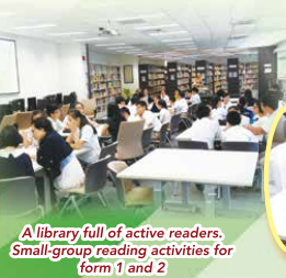
A library full of active readers. Small-group reading activities for form 1 and 2