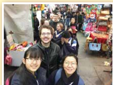
Say "Cheese"! ~Don't be shy!