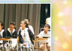
四社聖經問答比賽