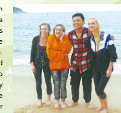
It is freezing cold out there.

The sightseeing trip in Cheung Chau has left me a lot of happy memories. I was excited that I had the chance to go to Cheung Po Tsai Cave. The cave is very dark and narrow. We walked down to the cave slowly and carefully and we had to turn on the smartphone's flashlight for illumination. The exit was very small so it was hard for us to get out. This was a wonderful trip which I was given the chance to communicate with the Americans. I learned about their culture and hobbies. They love the sea and collecting seashells at the beach. Moreover, my oral English has improved after the trip.