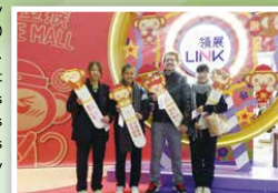
In a shopping arcade near Wong Tai Sin Temple