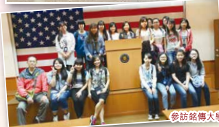
參訪銘傳大學(桃園校區)