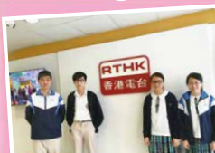
This is the students' first time visit to a radio station.