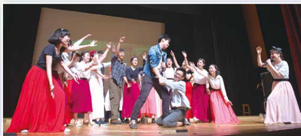
社際合唱比賽：馬太社精彩片段