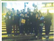
Tsim Sha Tsui

Thank you for this nice experience, the missionary team from South Dakota!