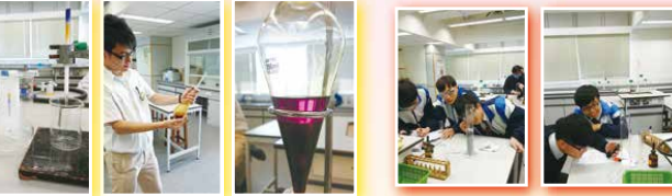
中六同學使用不同方法把化學品分離