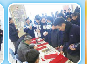
同學們耐心等待校長的墨寶