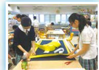
活動前數個月已著手設計及製作