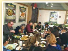
Dine out in a Chinese restaurant!

Our own-designed itinerary with signature by the missionary team