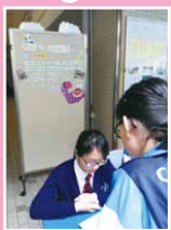
Reading Fun Fair-English Games