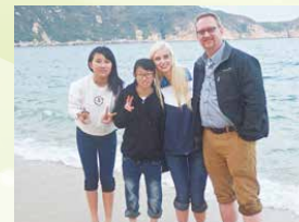
We have lots of fun at the beach.

In the sightseeing trip, I learned a lot about Cheung Chau's culture including when the Pak Tai Temple was built and the history behind it. I enjoyed the time spent with the missionary team. They told me about the education system in South Dakota and I found it very interesting. I think my oral English has improved too. I made some new friends that day and that was a good experience for me. I'm honored to represent CLS students to spend a day with the missionary team. I look forward to meeting them again next year.