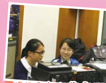
'Let's talk about selfie. Do you remember when was the first time you take a selfie?'