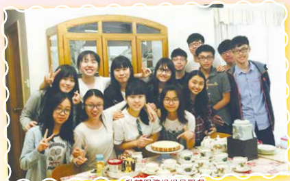
升輔服務組組員聚餐