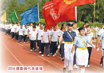
四社運動員代表進場