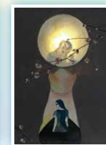
6F 溫慧儀 《流浪貓的懷念》(燈畫)