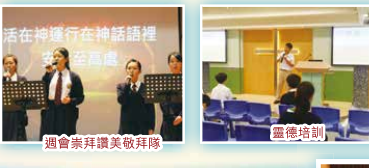
週會崇拜讚美敬拜隊