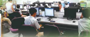
Miss Mui assists students with Online English programme