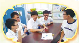
After-school Phonics Program