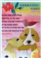
6D 胡汶欣 《美好世界 各從其類》