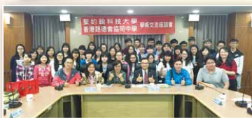
參訪聖約翰科技大學