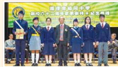
同學們於活動及服務皆有出色的表現