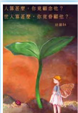
6B 湯美賢 《人算甚麼？上帝竟顧念他》