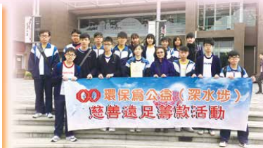
「環保為公益」慈善花卉義賣籌款 (銅獎)