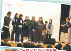
ACM帶領的聖誕慶祝會