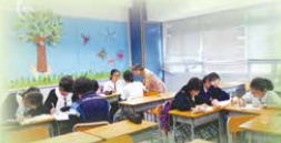
After-school TSA-prep speaking class for 53 students