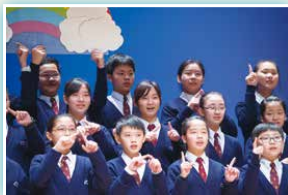
中一級最佳演繹及班際合唱亞軍：1B