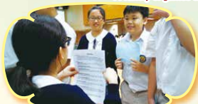
Student helpers are trying to get the players to try their best.