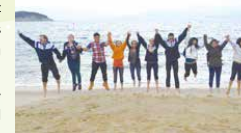
One Two Three JUMP!

What a wonderful trip! It's a great opportunity to talk to the Americans and learn about the American culture. I was surprised to see how crazy they could be when they play outdoors. We didn't communicate too much at the beginning. However, more and more Americans approached me to start a conversation. It's a time when east met west. I always wonder why it is so hard to speak in English in our daily life. Now, I'm much more confident to speak English because of this fabulous experience. Moreover, I learned more about Cheung Chau including the temples, local foods and popular sightseeing spots. That was not only an activity for students to improve their spoken English, it was also a great opportunity to learn more about Cheung Chau. Trust me, the scenery there is stunning. It's a great and fun trip with our friends in the States. I am looking forward to taking part in other similar activities like this with our lovely, kind and chatty friends from America again.