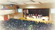
International Interface Team presentation at the assembly