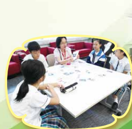
Miss Wong keeps her students guessing what's next with a reading lesson game.