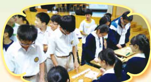
Students are lining up to play English games at Happy Hours.