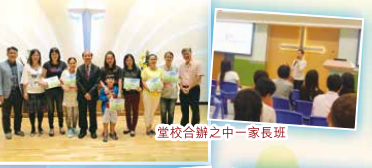
堂校合辦之「中一家長班」