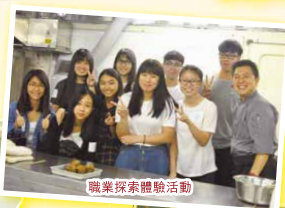
職業探索體驗活動