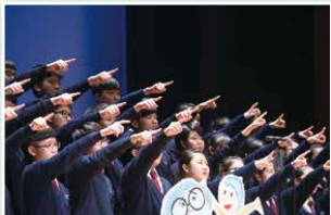
中三級班際合唱冠軍：3C