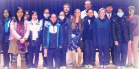
Drama Club-Reader's Theatre presentation at Friday Assembly