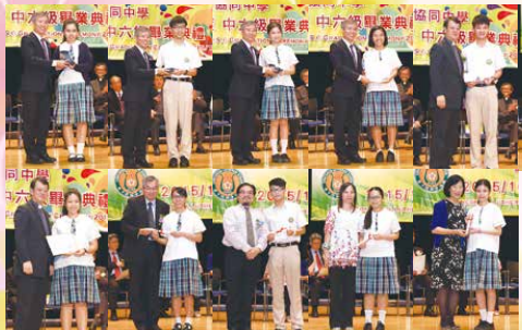
恭喜各位得獎的同學！