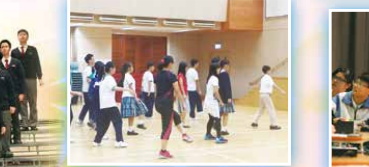
校園團契（以色列舞體驗）