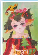
6F 李欣儀 《天空的飛鳥也不種也不收》