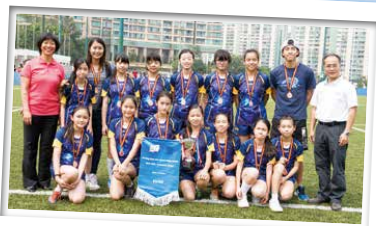
協同女子檳球隊首次出戰校際比賽，奪得季軍，成績不錯呢！(2015年3月)

去年9月，檳球隊來了新一批隊員，當大家還在質疑能否合作無間時，慶幸的是，這一批新隊員人才輩出，整體表現獲得了老師和教練的肯定。在今年的學界比賽中，有豐富經驗的師姐們帶著新力軍在初賽當天贏了漂亮的一仗。希望舊隊員們能帶領她們承先啟後，創出佳績。